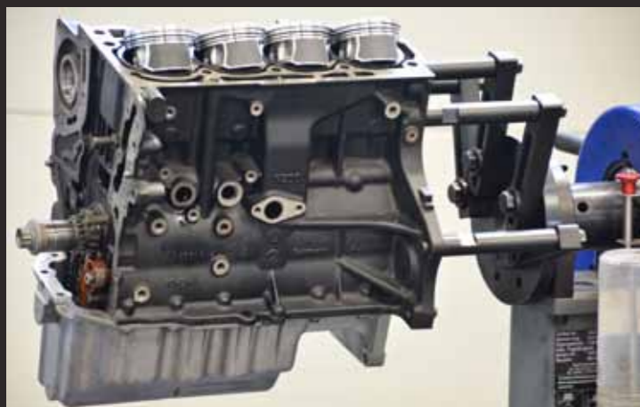
Revisie van een TSI-motor, klaar voor montage van de zuigers