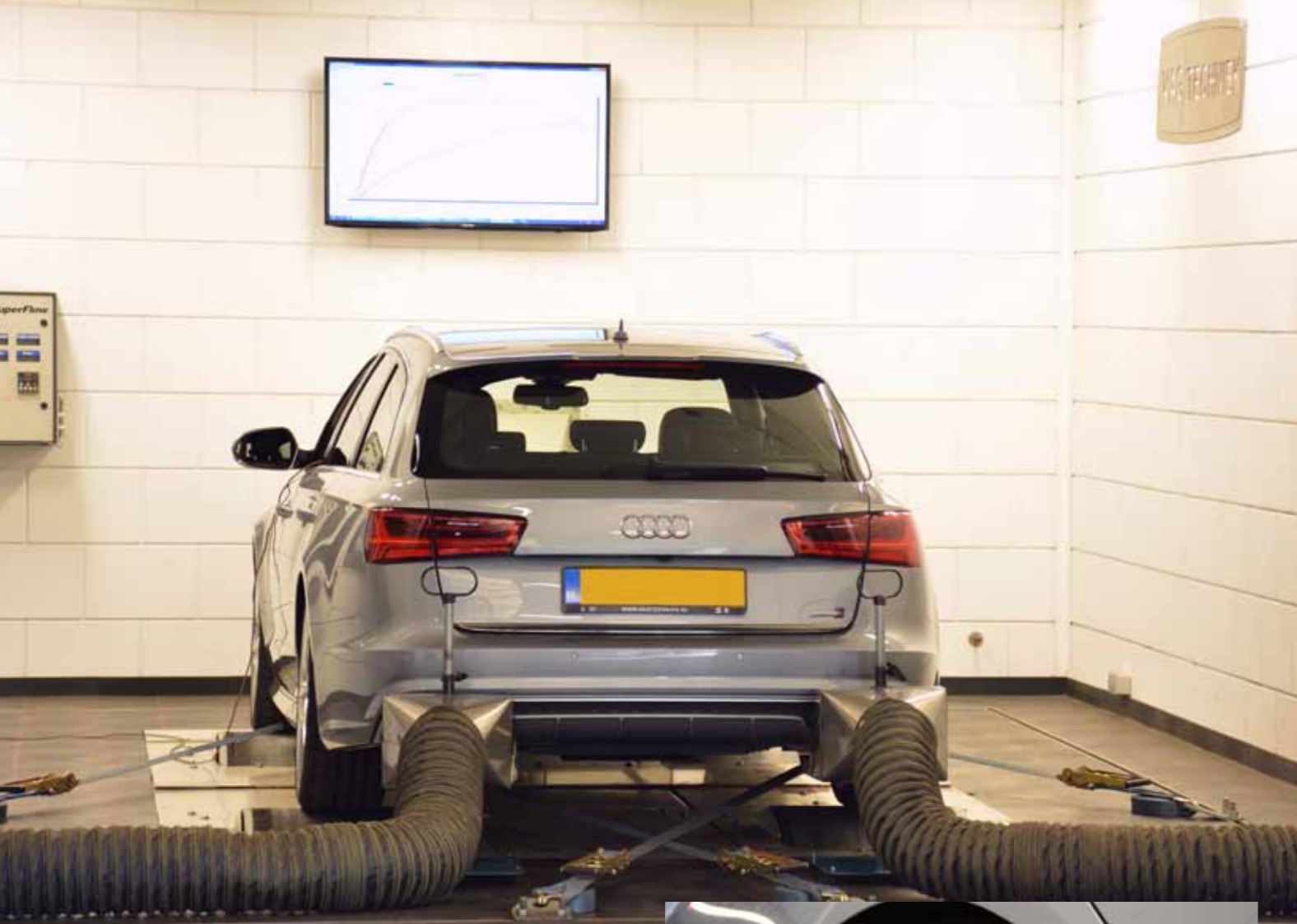
Bij Vagtechniek oogt alles ordelijk; zo ook de ruimte van de rollenbank