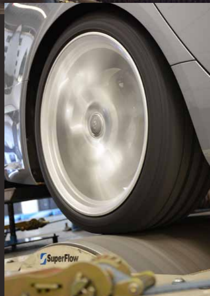
Vierwielaangedreven rollenbank van Superflow, de norm op dit gebied