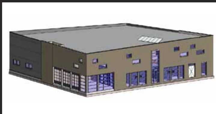
Het toekomstige bedrijfspand krijgt een heel transparant karakter