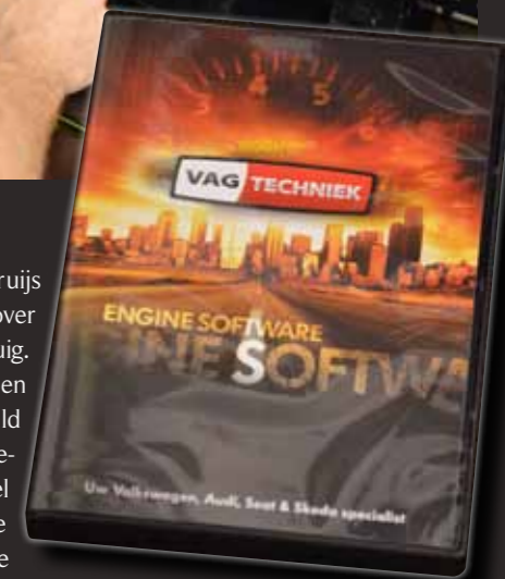
Klanten die hun auto laten chiptunen krijgen standaard deze dvd met software mee